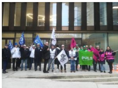
Nos collègues Belges du syndicat PULS étaient venus se joindre à notre mouvement

La CFE-CGC se mobilise pleinement pour continuer à défendre votre pouvoir d'achat lors de la dernière réunion de NAO, prévue le 3 février .